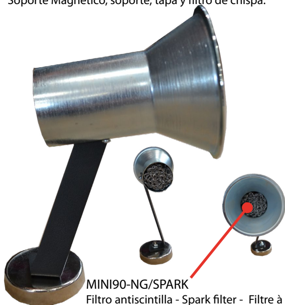
MINI90-NG/SPARK Filtro antiscintilla - Spark filter - Filtre à étin- celles - Funkenfilter - Filtro de chispas

Supporto magnetico, staffa, cappetta e filtro antiscintilla - Magnetic support, bracket, cap and spark filter - Support magnetique, support, capuchon et filtre à étin- celles - Magnet Halterung, Halterung, Kappe und Funkenfilter - Soporte Magnético, soporte, tapa y filtro de chispa.